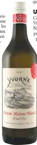
Les nectars de Château Maison-Blanche figurent parmi les meilleurs ambassadeurs de l'Association Clos, Domaines et Châteaux.