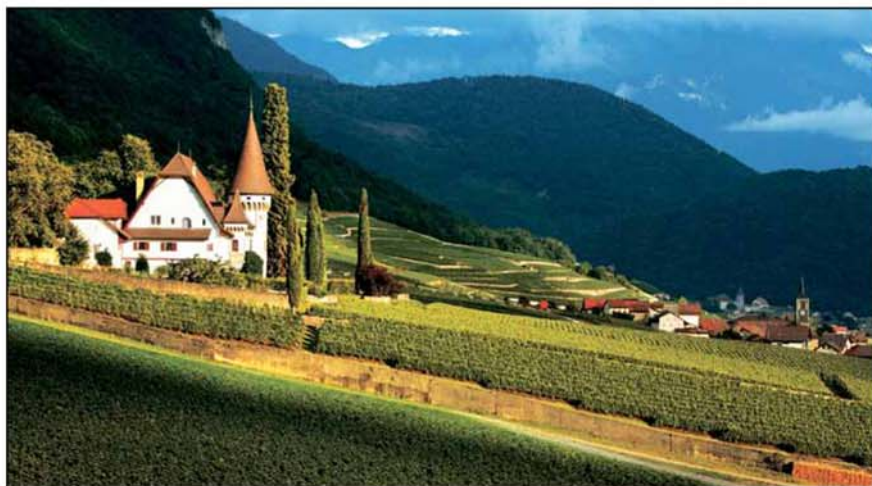
Le Château de Maison-Blanche: un décor historique de toute beauté.

VD — 400 ans pour le Château Maison-Blanche au cœur d'Yverne